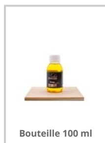
Bouteille 100 ml