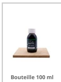
Bouteille 100 ml