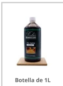
Botella de 1L