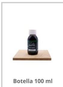
Botella 100 ml